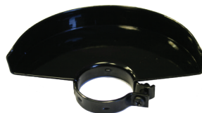
Zaščitni pokrov za brušenje.

*Prikazan ali opisan pribor ne spada v standardni obseg dobave.