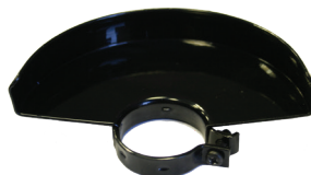
Заштитен осигурувач за брусене.

Внимателно прочитајте ги упатствата за употреба пред работа за да го намалите ризикот од повреди.