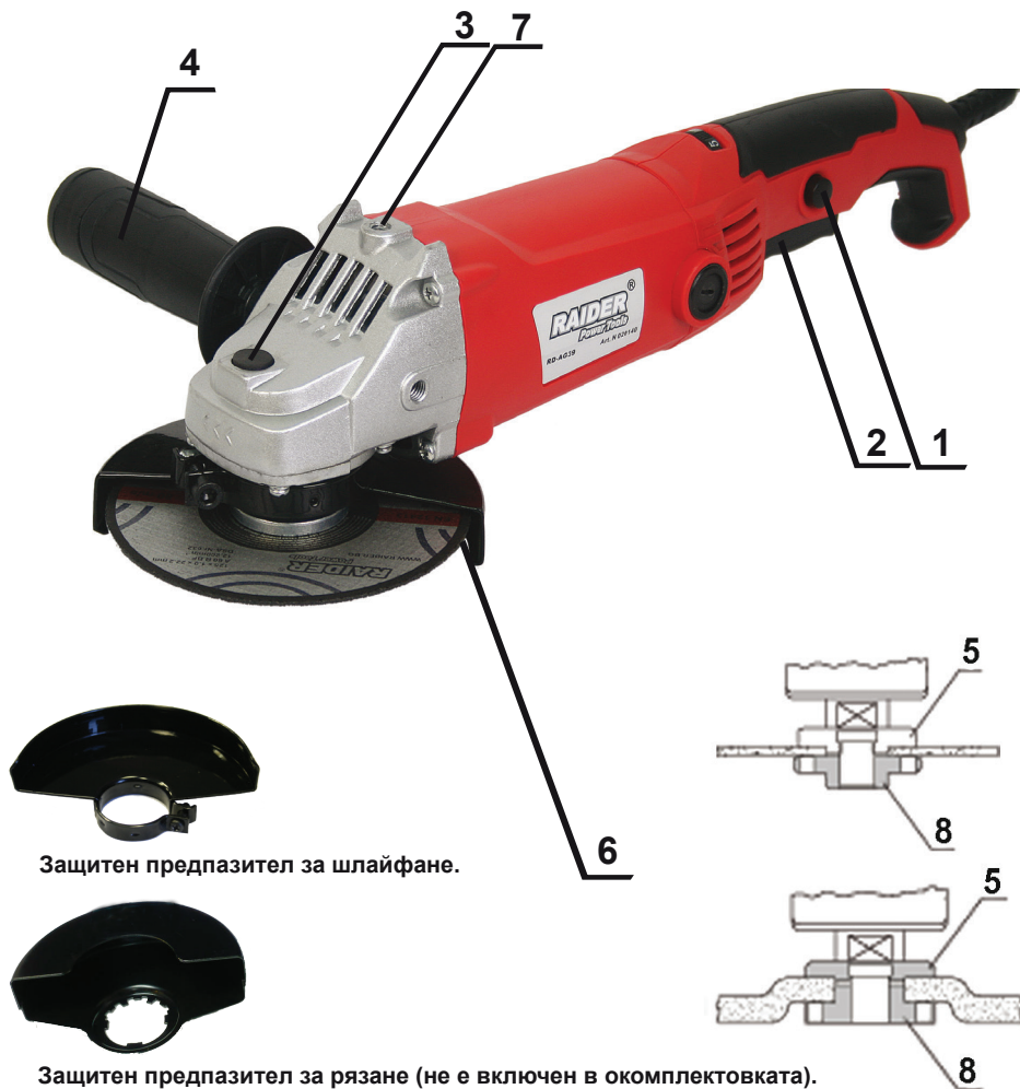
Защитен предпазител за шлайфане.