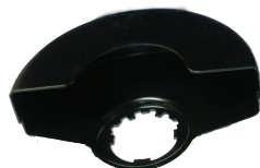
Защитен предпазител за рязане (не е включен в окомплектовката).