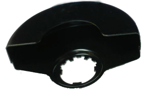
Protective guard for cutting. (Not included in the equipment.)